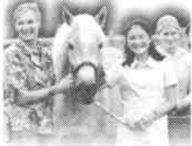
06年8月馬と戯れる眞子さま