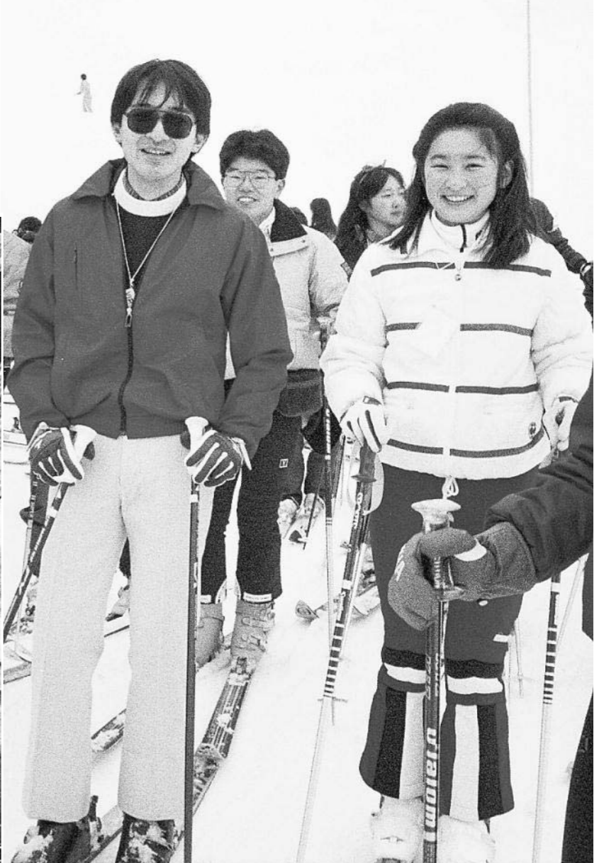
学生時代、紀子さまと一緒にスキーを楽しまれる秋篠宮さま=86年3月、長野県飯山市の斑尾高原スキー場