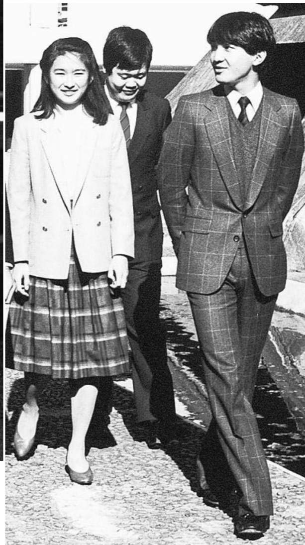
学生時代、学習院大のキャンパスを散歩される秋篠宮さまと紀子さま=85年11月