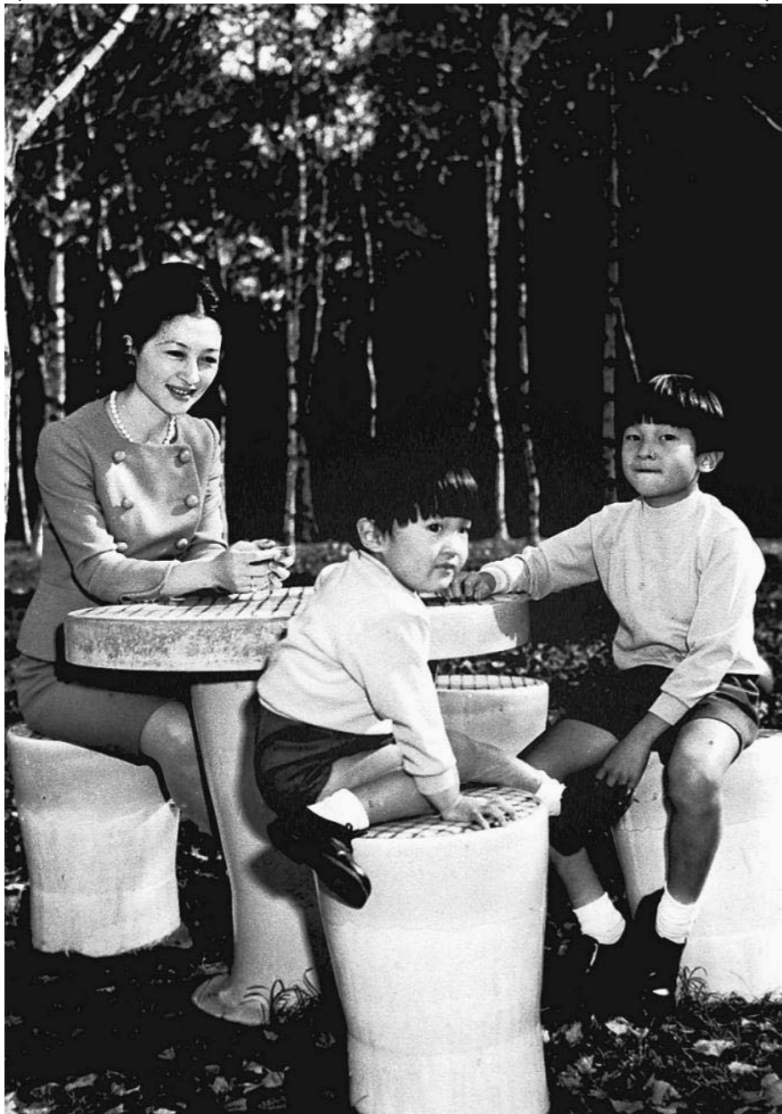
庭でつろがれる(右から)皇太子さま(浩宮)、秋篠宮さま(礼宮)、皇后さま=68年10月、東宮御所