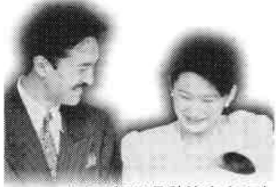
1991年11月秋篠宮さまと紀子さま、眞子さま