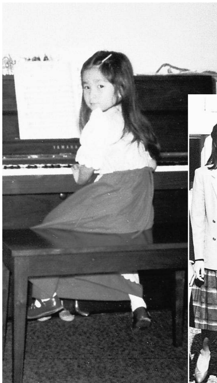
米フィラデルフィアの自宅でピアノをひく6歳当時の紀子さま=72年