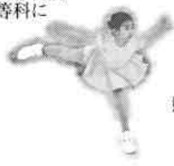
2004年4月フィギュアスケート競技大会で眞子さま